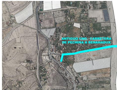
Antiguo camino-carretera de Pechina a Benahadux (en investigación)