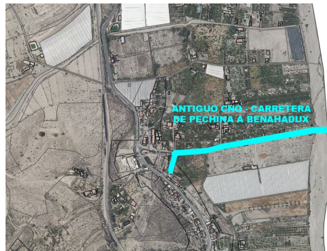
Antiguo camino-carretera de Pechina a Benahadux (en investigación)