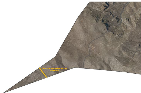
Camino-vía pecuaria de los conejos