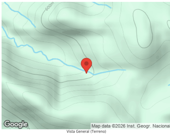
Map data ©2026 Inst. Geogr. Nacional Vista General (Terreno)